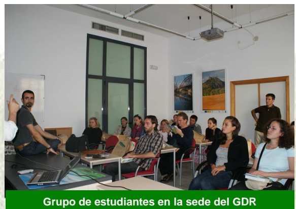
Grupo de estudiantes en la sede del GDR

Estos jóvenes universitarios de diferentes países como México, Finlandia, Alemania, Turquía, etc. se reúnen este año en torno a la temática “Mirando al mundo rural, pensando sobre lo global: Nuevos desafíos y oportunidades para los estudios rurales”.