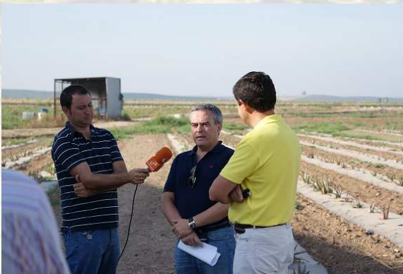
Momento de las jornadas

El Grupo de Desarrollo Rural del Medio Guadalquivir ha celebrado las I Jornadas de puertas abiertas en el campo de demostración de cultivos situado en la finca "El Encinarejo Alto", finca cedida por la Fundación Francisco Martínez Benavides y situada entre Palma del Río y Posadas.