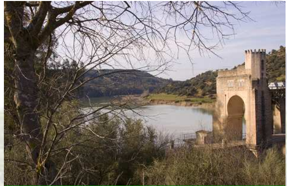
Embalse de El Salto, Río Guadalquivir, El Carpio

Este proyecto lo promueve el GDR Medio Guadalquivir con la colaboración del Ayuntamiento de El Carpio, y su objeto es el restaurar los parajes más representativos de las riberas del río Guadalquivir en su paso por el municipio a través de actuaciones como limpieza del cauce, plantaciones de especies forestales, señalización y diseño de rutas senderistas, etc.