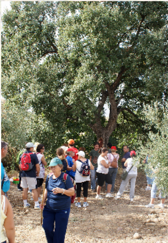
Participantes reunidos junto al alcornoque singular de El Lentisco

La ruta señalizada tiene siete kilómetros de longitud y recorre los principales paisajes que definen el territorio de La Carlota: ondulados campos de cereal, olivar y girasol, restos de dehesa con encinas centenarias, arroyos con vegetación de ribera, blancos cortijos y casas de colonos, etc.