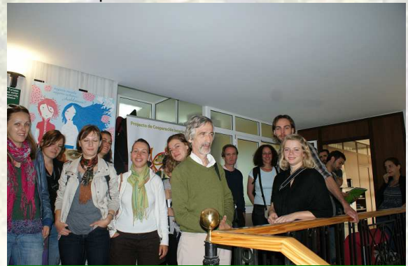
Grupo de estudiantes en la sede del GDR

El Grupo de Desarrollo del Medio Guadalquivir ha acogido esta semana a estudiantes de la Escuela de Verano “2010 ESRS SUMMER SCHOOL”. Este encuentro promovido por el Instituto de Estudios Sociales Avanzados de la Junta de Andalucía, se organiza cada dos años desde 1985 en diferentes lugares de Europa, como un medio de reunir a estudiantes de doctorado y postdoctorado de Sociología Rural con especialistas líderes en este campo de la Unión Europea.