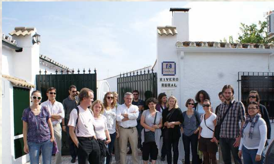
Grupo de estudiantes en la sede del GDR

Tras resolver algunas dudas expuestas por los estudiantes de sociología rural, se les ofreció la posibilidad de conocer in situ algunos de los proyectos que han sido financiados por el GDR Medio Guadalquivir, y que son símbolo inequívoco de la importancia del desarrollo rural, social y económico del Valle del Guadalquivir.