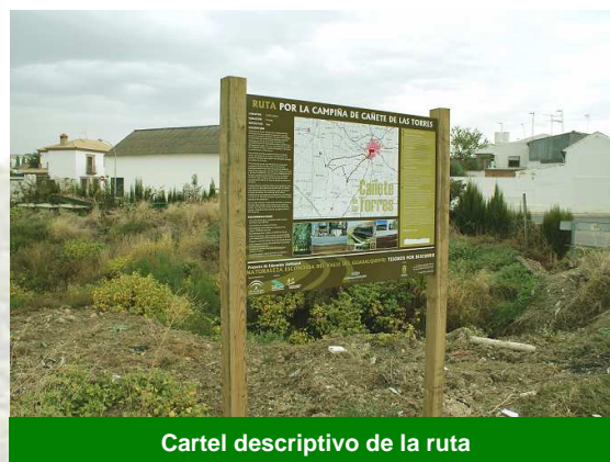
Cartel descriptivo de la ruta

Esta actividad se encuadra en el proyecto denominado "Naturaleza Escondida del Valle del Guadalquivir. Tesoros por Descubrir" puesto en marcha por la Asociación para el Desarrollo Rural del Medio Guadalquivir con el objetivo de difundir valores ambientales poco conocidos de los pueblos de la comarca y acercar la naturaleza a la población local. La metodología creada ya se ha aplicó en 2008 en Bujalance, señalizando la Ruta de las Vías Pecuarias con la colaboración de estudiantes del Colegio Inmaculada del Voto; y hace solo dos semanas en La Carlota, donde gracias a la participación de las asociaciones de mujeres locales se creó el recorrido Las Pinedas – El Arrecife – Parque de la Torrontera.