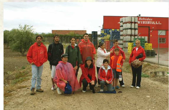
Participantes al inicio del recorrido

El pasado sábado por la mañana un grupo de 15 cañeteros convocados a través de asociaciones locales desafiaron a la lluvia para hacer el señalamiento de este nuevo recorrido senderista por Cañete de las Torres.