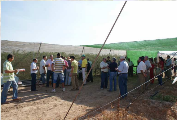
Momentos de las jornadas

Con estas jornadas el campo de demostración de cultivos se consolida como un instrumento de transferencia de conocimientos útil al sector agrario de la comarca, que esta abierto al público y al servicio del agricultor, buscando la demostración de producciones alternativas y la consolidación de producciones imprescindibles para la comarca como es el caso de los cítricos.