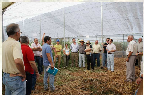
Momento de las jornadas

En la visita se pudo observar las producciones hortícolas de verano, donde se está probando con distintas variedades de cultivos de tomates, sandías, berenjenas, pimientos y melón, comparando las producciones tanto al aire libre, bajo umbráculo así como en invernadero.