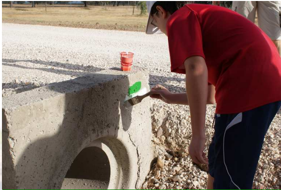
Un participante en la marcha señalizando la ruta

La ruta señalizada tiene siete kilómetros de longitud y recorre los principales paisajes que definen el territorio de La Carlota: ondulados campos de cereal, olivar y girasol, restos de dehesa con encinas centenarias, arroyos con vegetación de ribera, blancos cortijos y casas de colonos, etc.