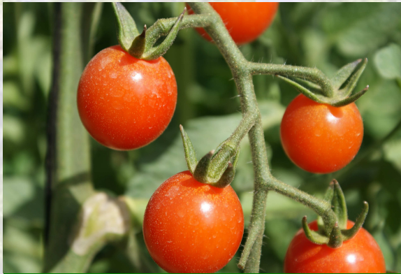
Detalle de la Producción Ecológica

Los trabajos realizados hasta la fecha han consistido en un estudio de viabilidad de la agricultura ecológica en la comarca, así como localizar a productores que tengan sus explotaciones en producción ecológica o en proceso de conversión a la misma, las industrias agroalimentarias también son objeto de estudio.