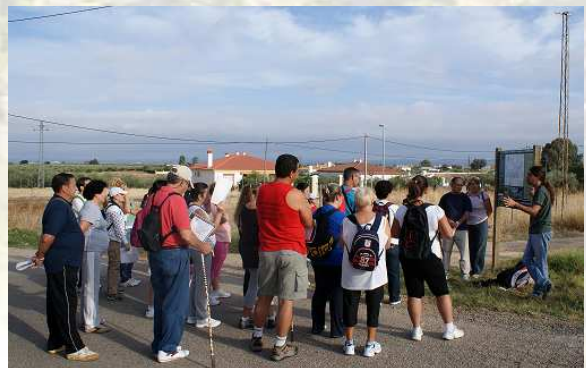
Explicaciones al inicio de la ruta

Los protagonistas de la señalización fueron un grupo de más de 30 voluntarios de todas las edades convocados a través de las asociaciones de mujeres de Las Pinedas (MUPI) y de El Arrecife (MUDARREF); y el escenario la ruta senderista Las Pinedas - El Arrecife - La Torrontera.